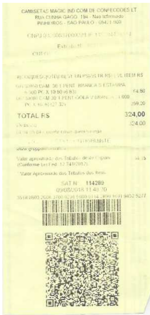
Figura 02: Nota fiscal de aquisição de camisetas para impressão de logo do Di Alma atualizado. Objetivo: identificação dos membros nas campanhas/doações em campo e também a venda de camisetas a terceiros com o objetivo de obter recursos para campanhas. Camisetas Magic Ind. Com. De Confecções LTDA (09/08/2018).